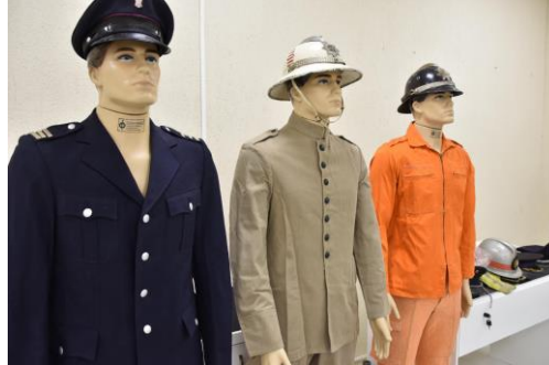
Fardamento de épocas