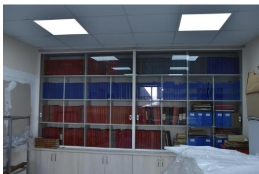
Boletins Internos desde 1912

Podemos citar além dos Boletins Internos os Boletins de Contadoria e Registros de Ocorrências ou ainda fatos marcantes da história do CB que foram registrados.