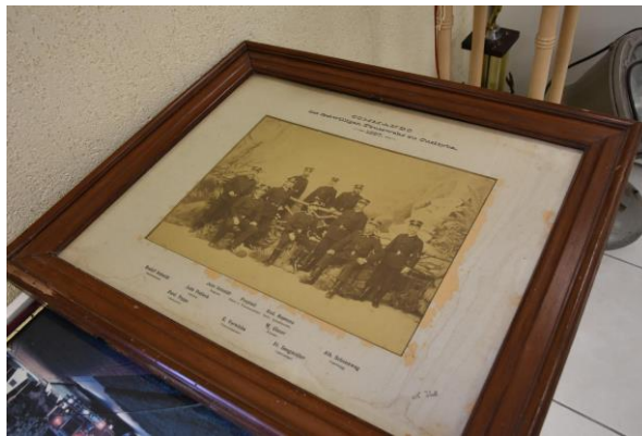
Quadro original de 1897, Primeiros Bombeiros de Curitiba

No conteúdo deste acervo poderá se encontrar arquivos em vídeos onde foram registrados instruções, entrevistas, matérias de reportagens, entre outros. Este acervo será catalogado, identificado e disposto de forma a ter seu acesso sempre que solicitado através dos meios atuais de informática.