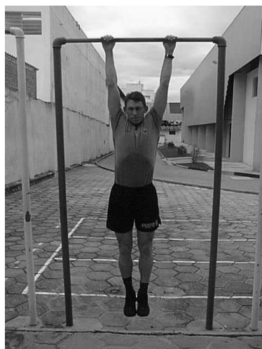
Figura 03 Posição 3 Final do Exercício