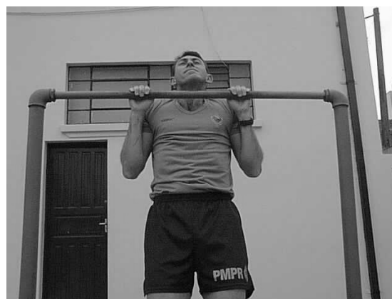
Figura 02 Posição 2 Intermediária.